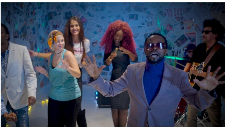
Ausschnitt aus Prince Zeka's Video zu „Ma jolie“

Alle Informationen auf: www.princezeka.com